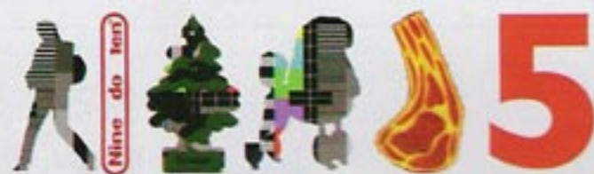
シリル君のギャラリー「caniche courage」のマーク、どこかパリティスト。